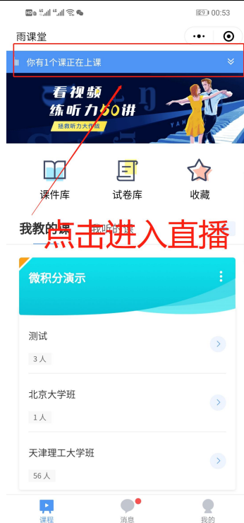
图 5 小程序进入直播界面