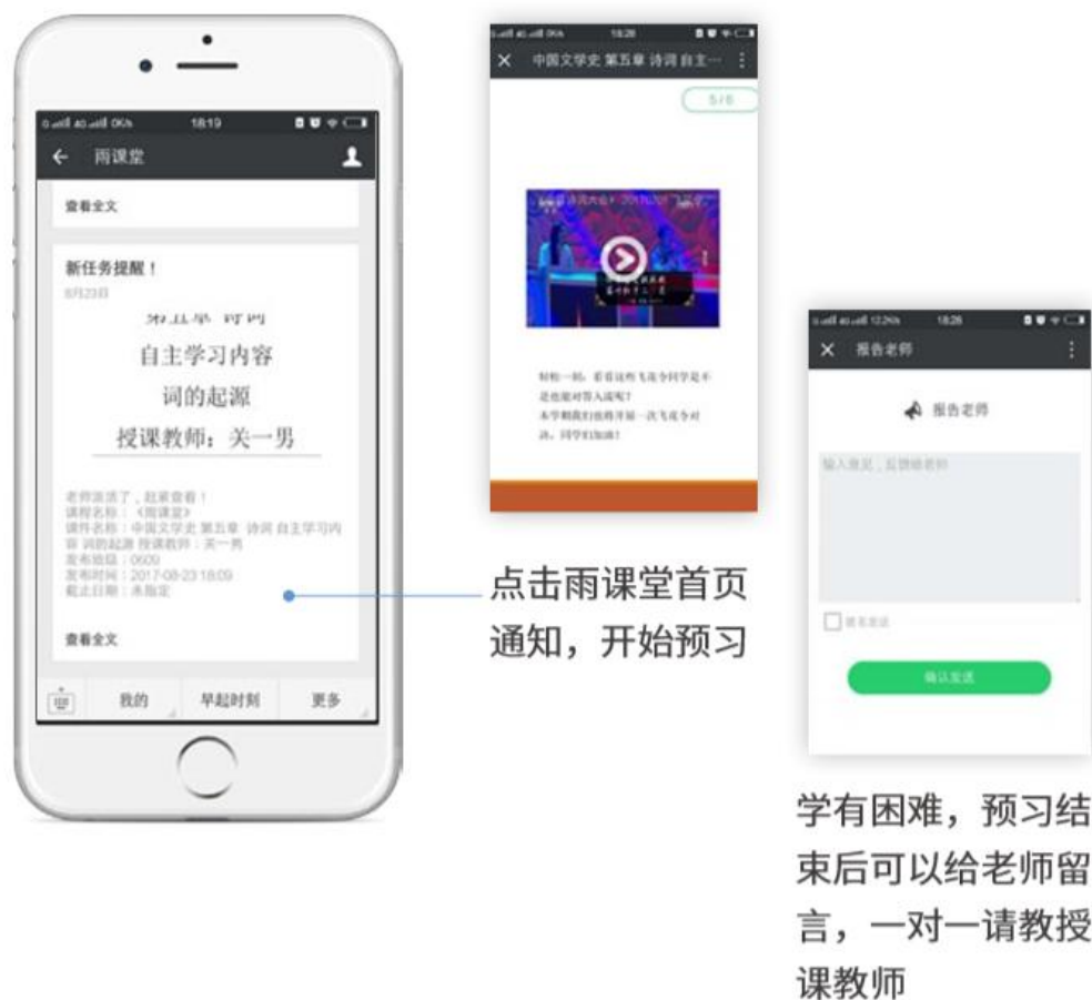
图 15 接收预习任务并完成预习

若老师给学生推送了预习资料，各位同学将在雨课堂公众号里收到相应的通知提醒，点击该提醒即可启动预习，预习之后带着思考去上课。（ 温馨提示：请在老师规定时间内完成预习。老师能看到你什么时候完成预习，预习了哪几页等信息 ）