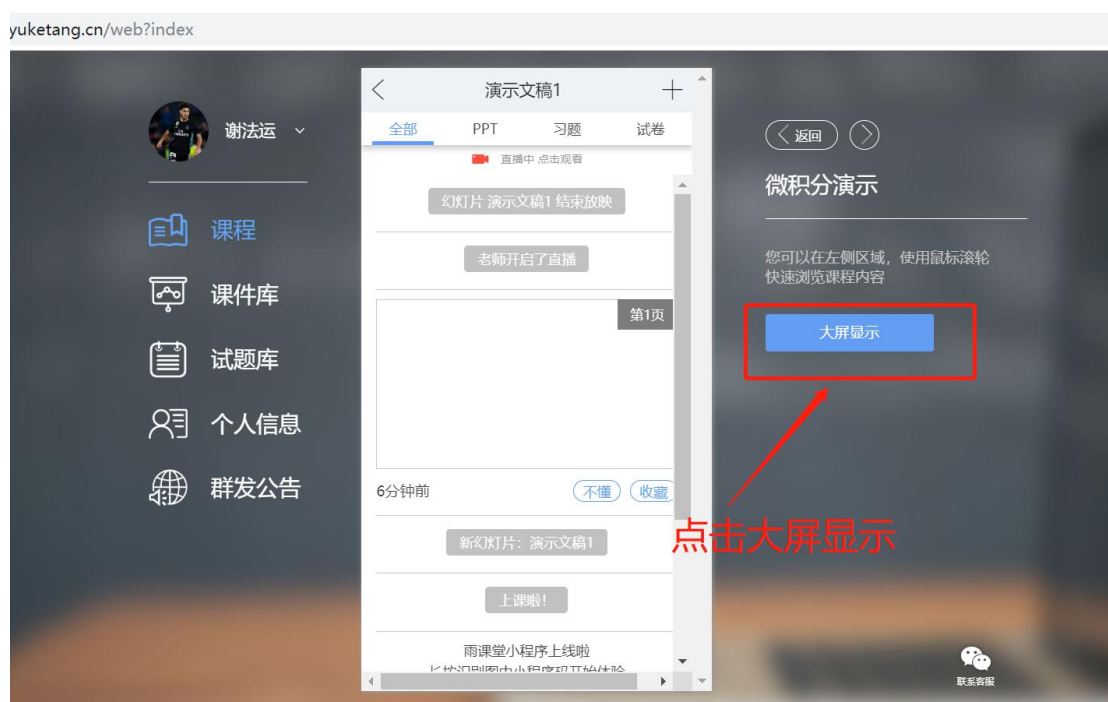
图 9 可进入大屏显示