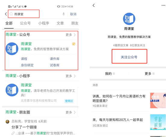
图 1 关注“雨课堂”