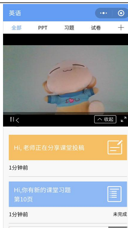
图 9 学生手机端直播预览效果