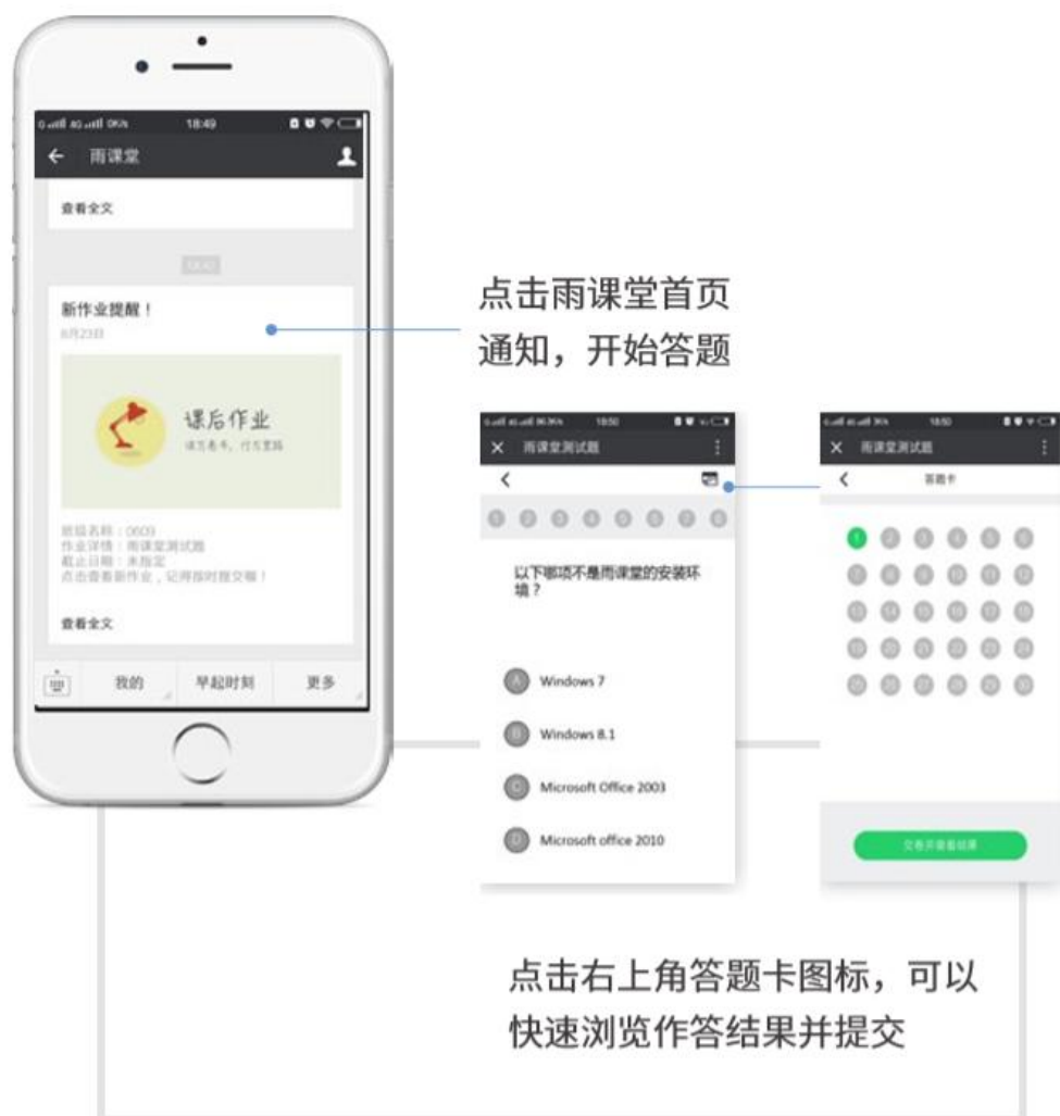
图 16 作业提醒