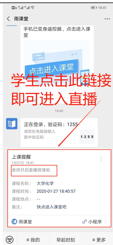
图 3 学生接收上课直播提醒