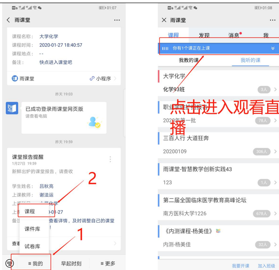
图 6 公众号进入直播