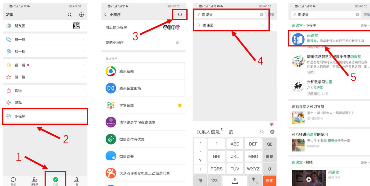
图 4 搜索进入雨课堂小程序

进入雨课堂小程序后，在小程序上方若发现有“你有 1 个课正在上课”的提示，点击该提示即可进入直播。如图 5 所示。